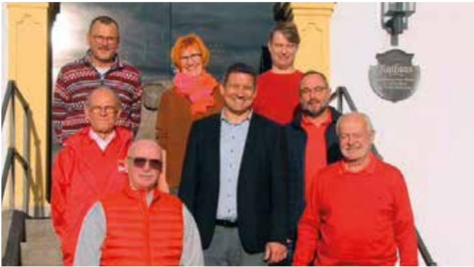
SPD Ortsverein Randersacker & Lindelbach