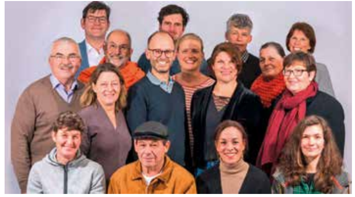
ödp/Aktive Bürgerschaft Randersacker