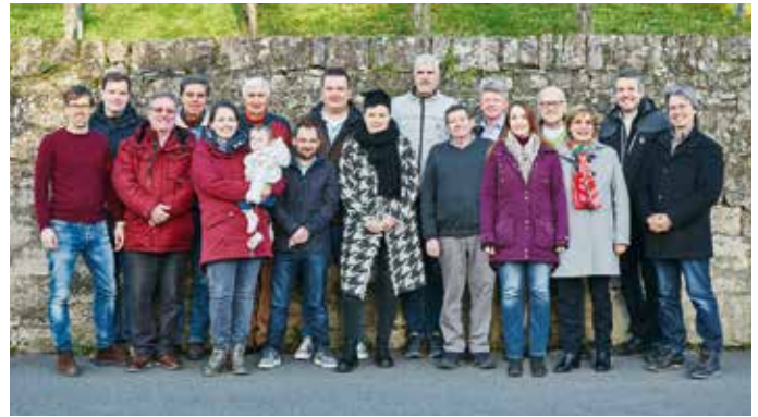
UWG Randersacker e.V.